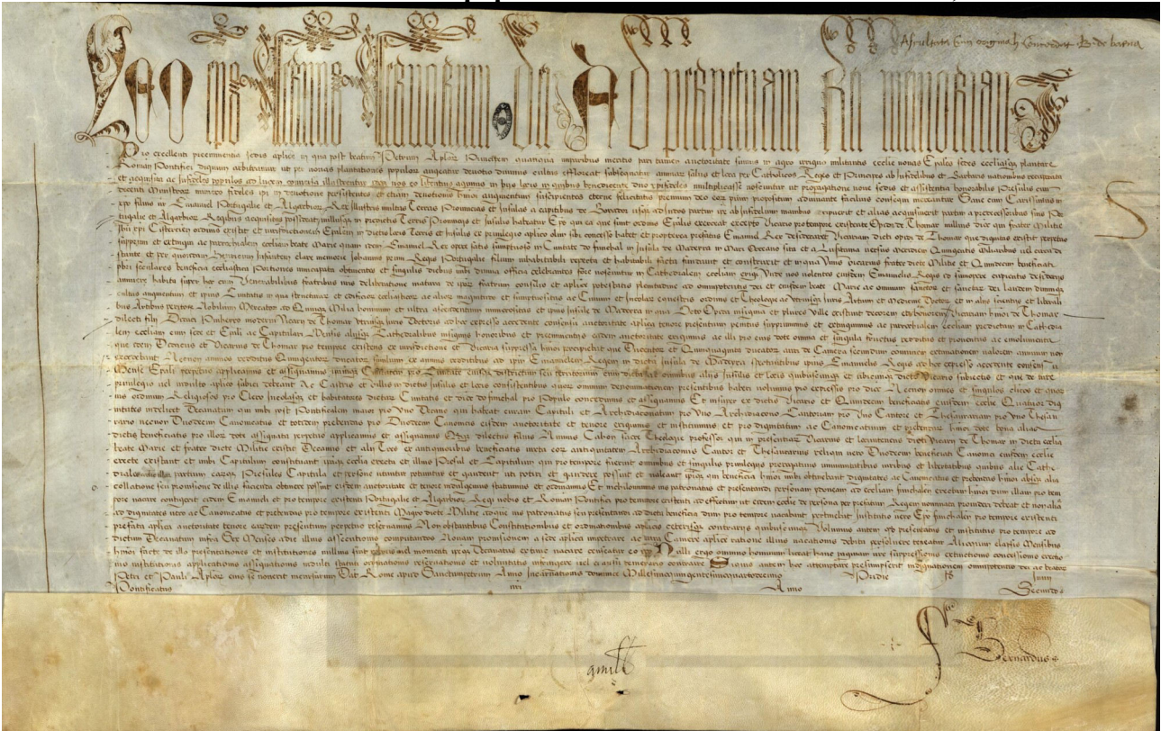
Archives Nationales de Lisbonne (Arquivo Nacional da Torre do Tombo – ANTT), Bulas, mç. 20, n.º 34.