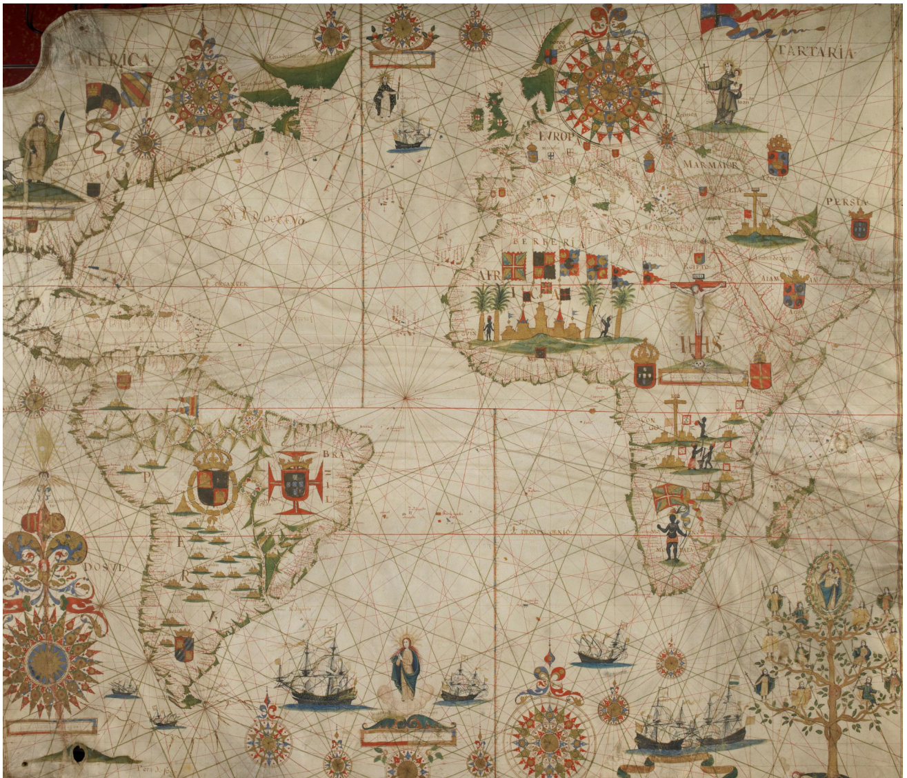
Pascoal Rodrigues - Carta: Atlântico, extremo Sudeste do Pacífico e Sudoeste do Oceano Índico, 1632. MS.6. Coll. Bibliothèque municipale de Dinan.

Le diocèse de Funchal, dans l'île de Madère, fut le premier à promouvoir la mondialisation du catholicisme à l'époque moderne. En effet, l'ensemble des possessions lusitaniennes dans l'espace atlantique, considérées jusqu'alors comme des territoires nullius dioceses 26 , fut soumis à la juridiction spirituelle de ce nouvel évêché et de son évêque (D. Diogo Pinheiro), ce dernier nommé par le roi D. Manuel I (1495-1521). Cette décision obéissait à une complexe stratégie de renforcement du pouvoir royal pour réduire l'influence de l'Ordre du Christ sur les territoires outre-mer, en élargissant la capacité d'intervention du roi par l'intervention de ses droits de patronage.