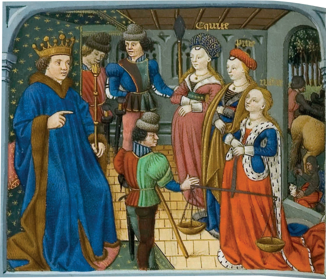
La Cité de Dieu, ©Bibliothèque du Château de Chantilly, ms. 122, f. 113v 1 ère page : Changeur ©Bibliothèque municipale de Besançon, ms. 0434, f. 272 ; Livre de comptes suivi de «Beruht» ©Bibliothèque des musées de Strasbourg, ms. 18. Clichés: IRHT-CNRS