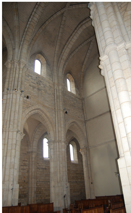
Les deux premières travées orientales de la nef de l'abbatiale d'Acey, vue depuis la croisée du transept. On peut observer les voûtes d'ogives de la nef, les arcs brisés des arcades et formerets, mais l'élévation à deux niveaux. On distingue également les voûtes d'arêtes des collatéraux.

On comprend alors que l'abbatiale d'Acey est un jalon dans l'adoption de l'architecture gothique cistercienne dans le diocèse de Besançon. De ces observations découle naturellement une réflexion plus large portant sur la diffusion de ce nouveau courant dans les abbayes de la filiation de Clairvaux dans le diocèse de Besançon durant la seconde moitié du XII e siècle. Son apparition à partir des années 1150 entraîne ainsi un tournant dans l'architecture cistercienne et son emploi à l'abbatiale de Cherlieu lui permet d'entrer dans le diocèse de Besançon, pourtant réticent à l'époque au courant gothique issu d'Île-de-France. Nous nous proposons donc, dans le cadre d'un contrat doctoral avec le LabEx Hastec, d'étudier les formes, les modalités et les raisons de l'adoption et de