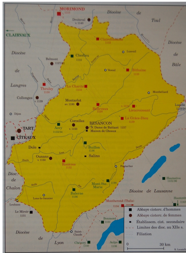
Carte de la Franche-Comté cistercienne au XII e siècle, par R. Locatelli, présentée dans l'ouvrage La création architecturale en Franche-Comté au XII e siècle... , p. 31.

la diffusion de l'architecture gothique cistercienne au sein d'un ordre et d'une région en théorie peu enclins à l'accepter.