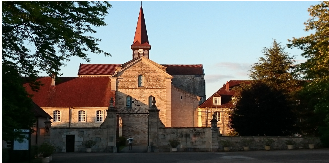
L'abbaye Notre-Dame d'Acey (Jura), vue depuis l'ouest

Dans le cadre de ma scolarité à l'École nationale des chartes, j'ai réalisé une thèse d'école intitulée L'église abbatiale cistercienne Notre-Dame d'Acey. Étude historique, architecturale et archéologique . L'abbaye Notre-Dame d'Acey, fondée en 1133/1134 dans l'actuel département du Jura, est aujourd'hui un unicum en Franche-Comté puisqu'il s'agit de la dernière abbaye masculine de l'ordre cistercien à être encore occupée par une communauté monastique. De plus, elle conserve son église d'origine, bien que restaurée et remaniée au fil des siècles, quand il ne reste que quelques vestiges des autres édifices du même ordre. La situation exceptionnelle de cette abbaye explique le nombre important d'études historiques et architecturales menées à son sujet depuis le XIX e siècle. Aujourd'hui, l'ouvrage de MM. Gresser, Gresset, Locatelli et Vuillemin, L'abbaye Notre-Dame d'Acey , fait référence pour son histoire.