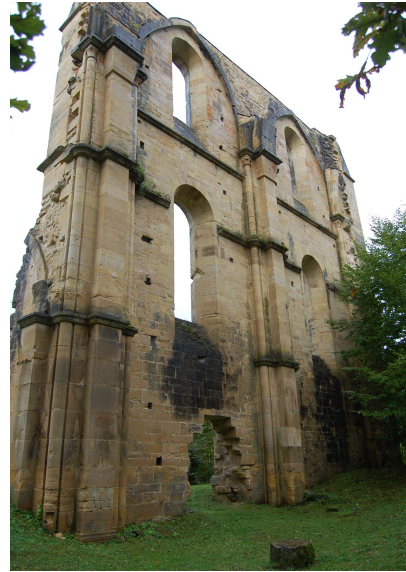
Mur occidental du bras nord du transept de l'abbatiale de Cherlieu, vu depuis l'ouest (à gauche) et l'est (à droite).

L'abbaye d'Acey, fondée en 1133/ 1134 dans l'actuel département du Jura, est l'aboutissement d'une expérience érémitique qui prenait place dans la forêt de Serre, à cinq kilomètres environ au sud-ouest du site de l'abbaye. Comme nous l'avons vu, son histoire est désormais bien connue par l'ouvrage de MM. Gresser, Gresset, Locatelli et Vuillemin, tandis que l'abbatiale a fait l'objet de ma thèse d'École nationale des chartes.