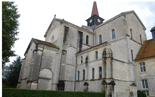
L'abbatiale d'Acey, vue depuis l'est.

L'abbaye d'Acey, fondée en 1133/ 1134 dans l'actuel département du Jura, est l'aboutissement d'une expérience érémitique qui prenait place dans la forêt de Serre, à cinq kilomètres environ au sud-ouest du site de l'abbaye. Comme nous l'avons vu, son histoire est désormais bien connue par l'ouvrage de MM. Gresser, Gresset, Locatelli et Vuillemin, tandis que l'abbatiale a fait l'objet de ma thèse d'École nationale des chartes.