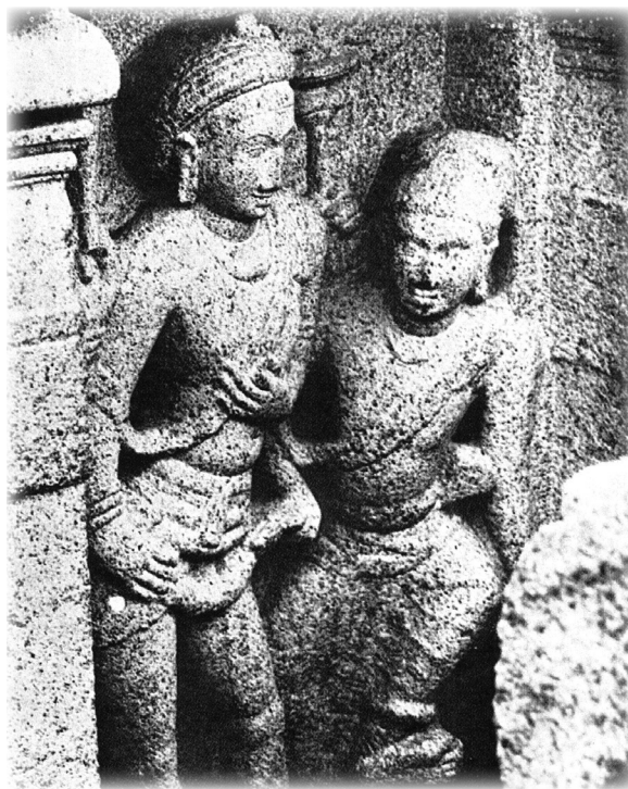
Mahābalipuram, Pallava, VII e siècle. Śiva enseigne l'art de la danse à Taṇḍu, comme il est montré au chapitre IV du Nāṭyaśāstra.

16h00 : Carl Ernst (University of North Carolina) « Disentangling the Different Persian Translations of The Pool of Nectar (Amṛtakunḍa) »