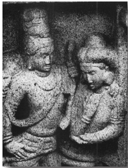
Mahābalipuram, Pallava, VII e siècle. Śiva enseigne les règles du théâtre à Bharata, l'auteur mythique du Nāṭyaśāstra . Bharata se tient dans l'attitude déferente du disciple, bras droit replié, coude reposant dans la paume gauche.